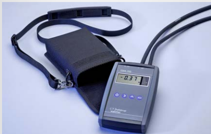
Valigetta a tracolla EMA 200 Codice art. 9074.0001