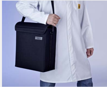
Tragetasche KAL 100 / 200 bereits im Lieferumfang enthalten