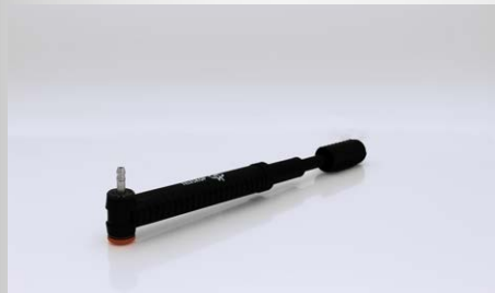
Handpumpe KAL 84 Best.-Nr. 9601.0036