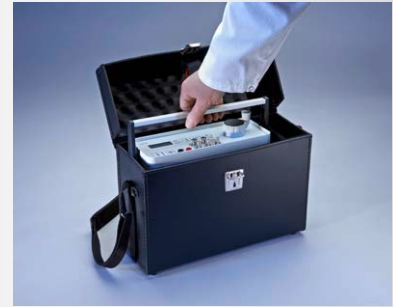
Tragetasche KAL 84 Best.-Nr. 9062.0001