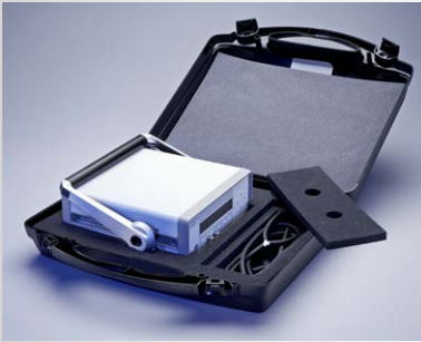
Transportkoffer KAL 100 / 200 Best.-Nr. 9220.0002