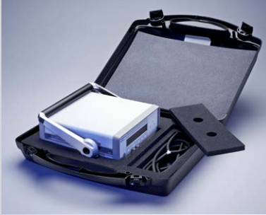
Transportkoffer KAL 100 / 200 Best.-Nr. 9220.0002