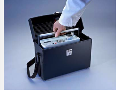
Tragetasche KAL 84 Best.-Nr. 9062.0001