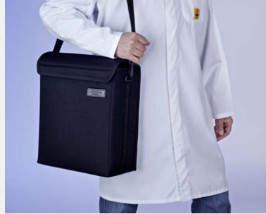
Tragetasche KAL 100 / 200 bereits im Lieferumfang enthalten